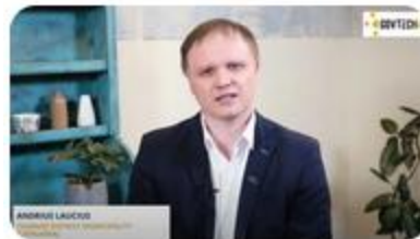
Municipality of Tauragė (Lithuania)